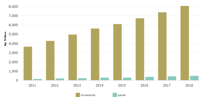
Gambar 1: Grafik Pertumbuhan Total Aset Perbankan Syariah Dan Konvensional

Aisy dan Mawardi (2016) 14 Faktor eksternal akan lebih mempengaruhi pertumbuhan aset bank syariah melalui faktor internal bank syariah, dibandingkan pengaruhnya secara langsung terhadap pertumbuhan aset bank syariah.